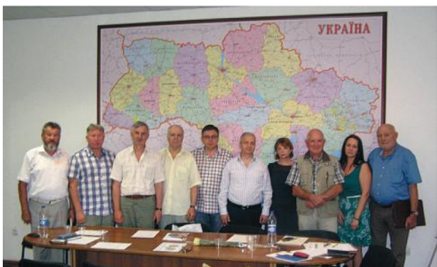
Засідання правління УТГК