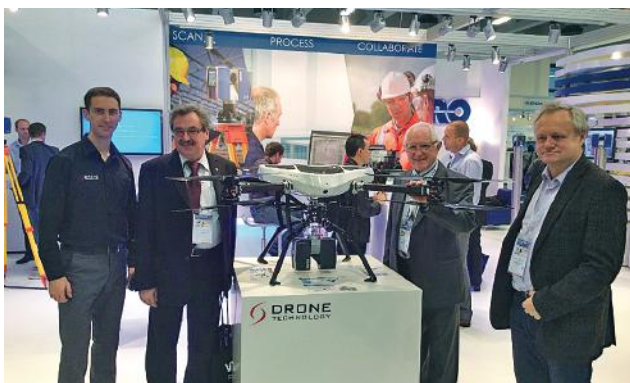
Делегація УТГК на конгресі INTERGEO (Німеччина)