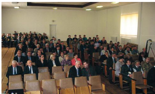
Відкриття МНТК "Геофорум-2016"