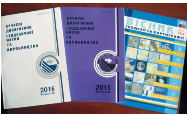
Видавнича діяльність УТГК