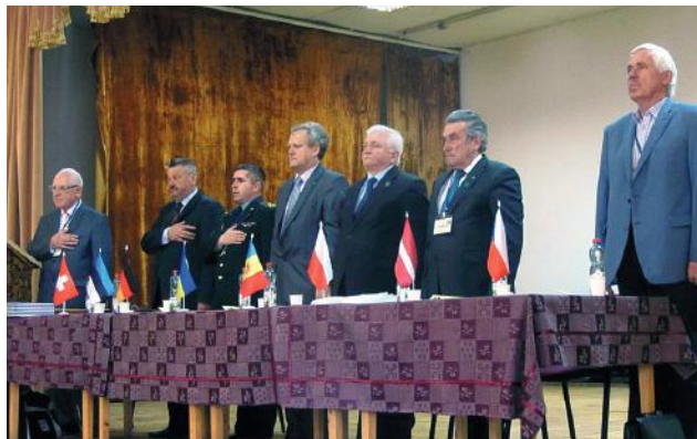
Президія МНТК "Геофорум" під час відкриття конференції