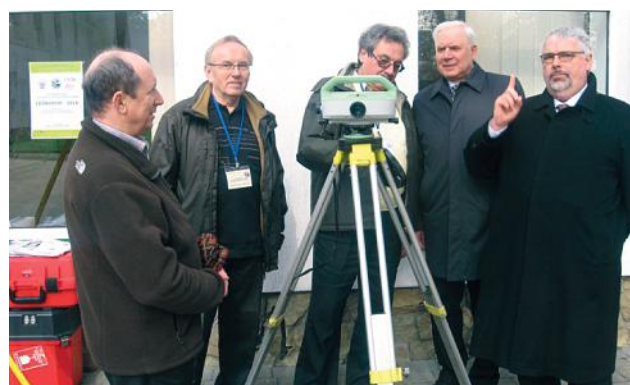
На виставці сучасного геодезичного обладнання