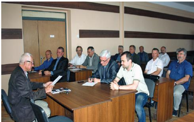
На засіданні правління Західного геодезичного товариства УТГК