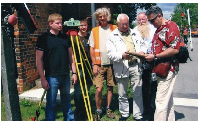
Проведення наукових досліджень у м. Нойнбрандербург