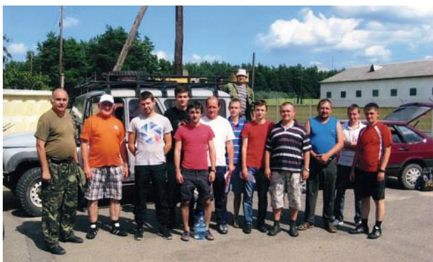
Під час наукової експедиції на НГП (Яворів)