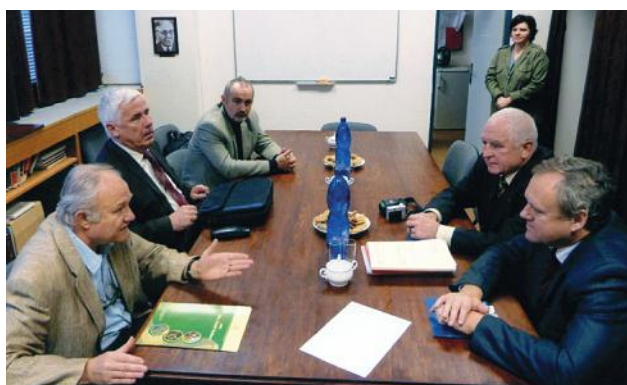
На переговорах делегації УТГК у Чехії