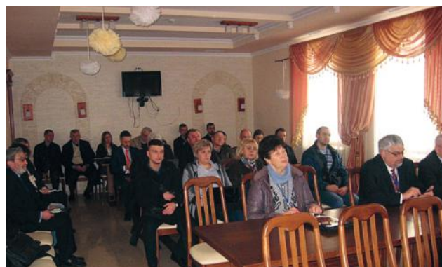
На секційному засіданні МНТК "Геофорум-2016"